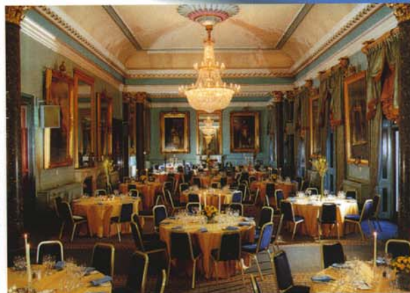
Nash Room, место проведения церемонии, по имени известного архитектора 19-ого века Джона Нэша, построившего здание Института Директоров

Институт Директоров был основан более 100 лет назад видными бизнесменами Великобритании для поддержки директоров компаний в развитии их бизнеса как на национальном, так и международном уровнях. Сегодня, имея своими членами более 70000 директоров компаний, ИД является мощной и влиятельной организацией. Помимо своей высокопрестижной штаб-квартиры на ул. Пел Мел 116 и бизнес-центра высоких технологий, Пел Мел 123, Институт Директоров располагает центрами в Белфасте, Бирмингеме, Бристоле, Эдинбурге, Манчестере и Ноттингеме, а также во всех главных британских аэропортах. Недавно Институт Директоров открыл свои представительства в Париже и Брюсселе и установил связи с родственными организациями по всей Центральной Европе. Все это делает Институт Директоров наиболее уважаемой независимой ассоциацией управляющих директоров компаний, распространяющей экономическое и институциональное пространство, в котором бизнес может развиваться и расти.